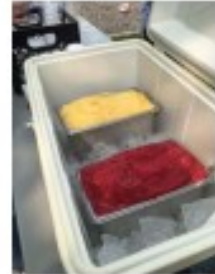
École Saint-Louis Cirque de la Pointe-sèche, maquillage Et gâteries