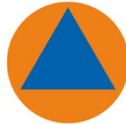
Logo international de la sécurité civile

La Municipalité convoquera sous peu les membres du Comité en sécurité civile (employés municipaux et élus), ainsi que les citoyens qui ont donné leur nom le printemps dernier pour être bénévole lors d'un sinistre. Il s'agira d'un exercice de table, qui s'effectuera en salle. Il a pour but d'échanger sur une situation simulée, et ne requiert aucun déploiement de ressources sur le terrain.