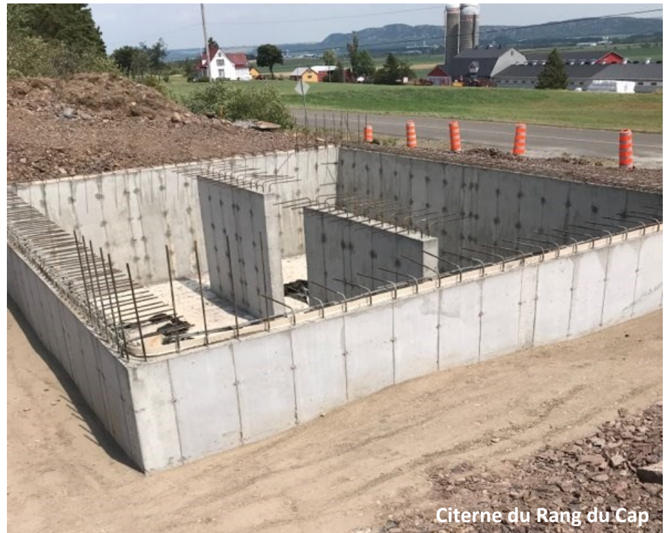
Citerne du Rang du Cap

municipalités afin que les réservoirs-incendie puissent