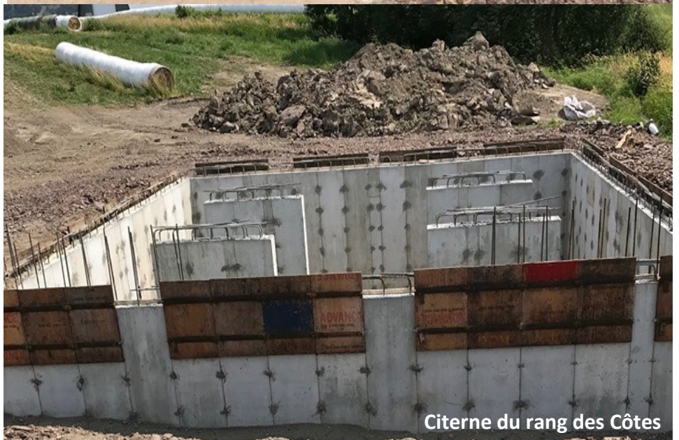
Citerne du rang des Côtes

encore s'appliquer sur la Municipalité de Kamouraska TECQ.