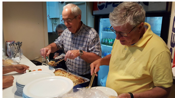
Comme nos mères! Nos deux Maires

En terminant, il est important de dire que le succès de cet événement serait impossible sans l'apport des partenaires et des nombreux bénévoles qui sont fidèles au rendez-vous à chaque édition. Le Symposium mobilise plus de soixante-quinze bénévoles que nous voulons remercier chaleureusement.