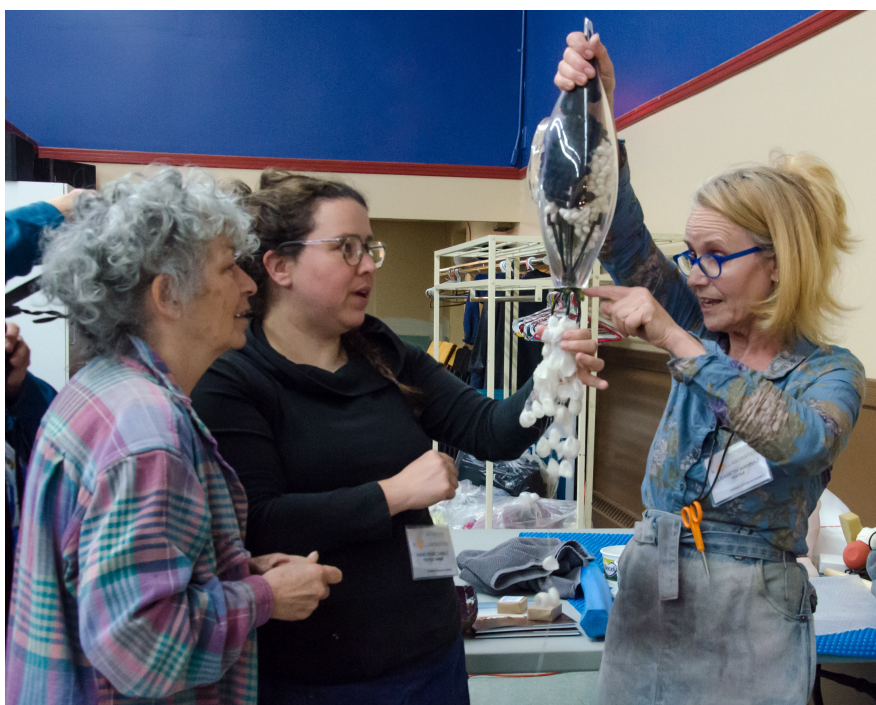
Des artistes en pleine création collective

K(o)llaboration s'inspire et s'inscrit dans un réseau d'événements de type séminaire de collaboration, déjà bien établi à l'international ; c'était la première fois qu'un tel événement était organisé au Québec. .