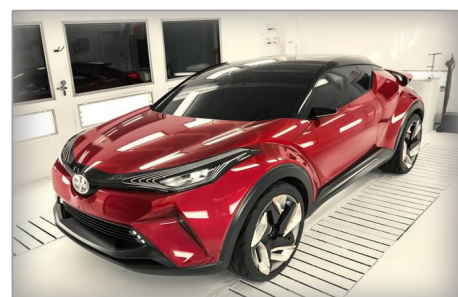
Nouveau CH-R 2017

Venez me rencontrer, il me fera plaisir de vous conseiller