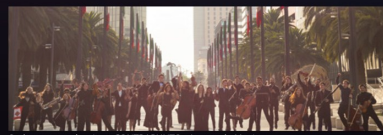
Orchestre symphonique CONTRAPUNTO - Jeunes de Mexico