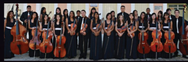
Orchestre à cordes FUNFEC - Jeunes du Brésil