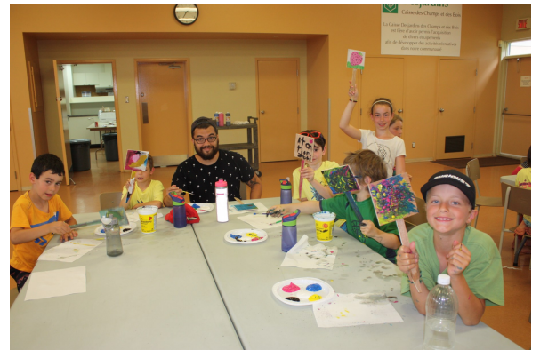
L'équipe de Kamouraska lors du Symposium pour enfants