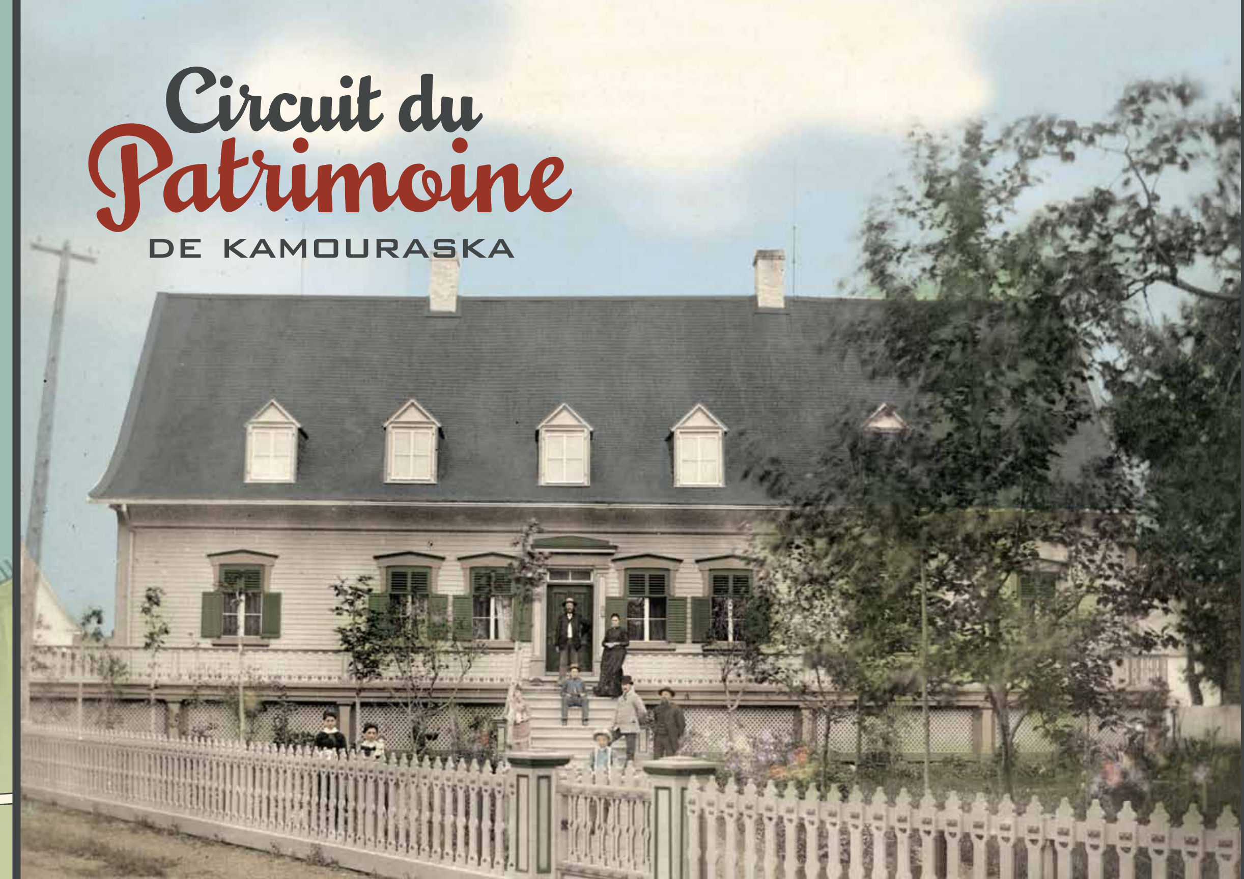
Photo : Maison Gagnaire-Michard au 65, avenue Morel / Auteur inconnu, Collection Magdeleine Michard Bossé / Coloration : Miguel Forest